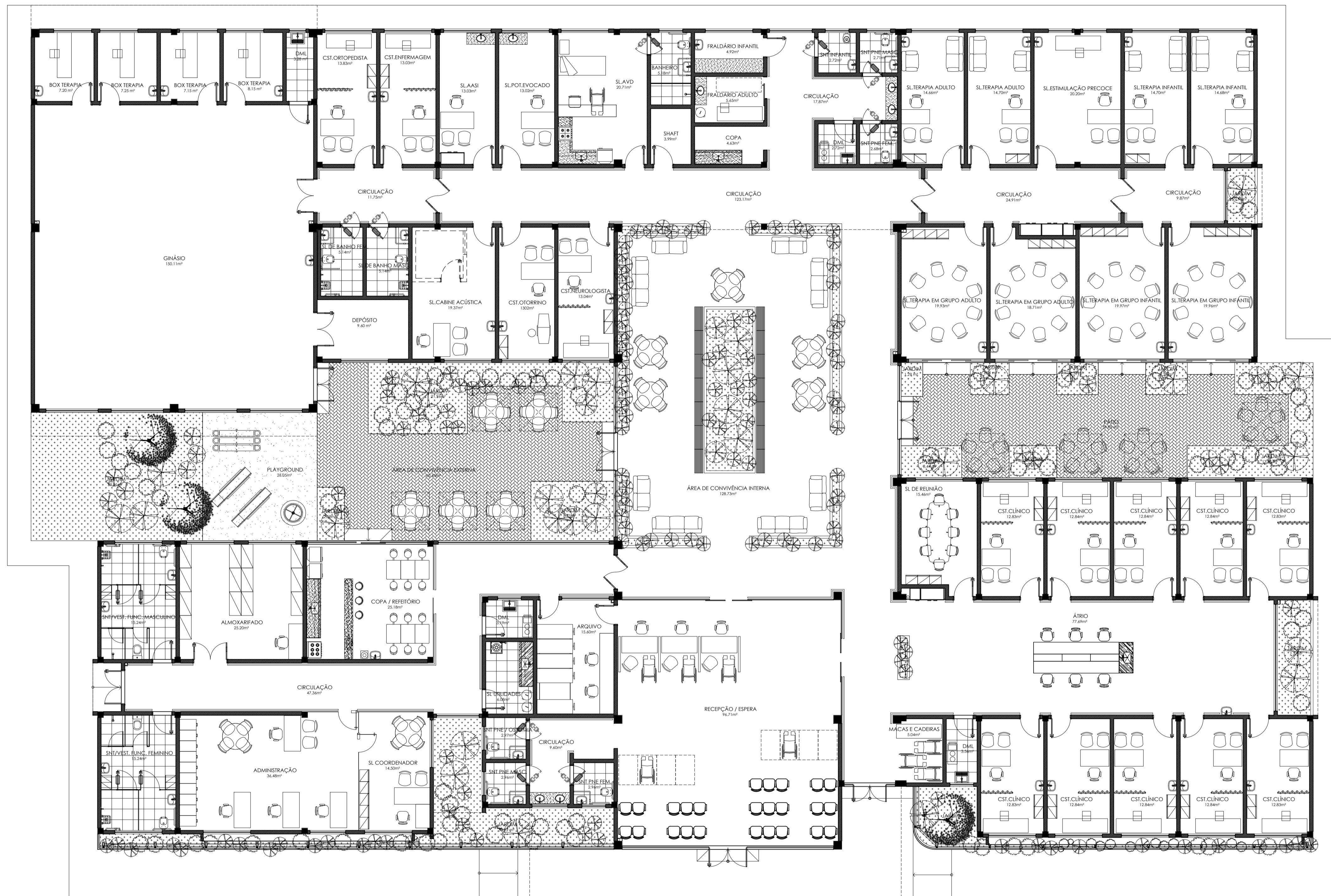
01 TIPO 3 / CER III - PLANTA DE LAYOUT ESQ: 1:1.000