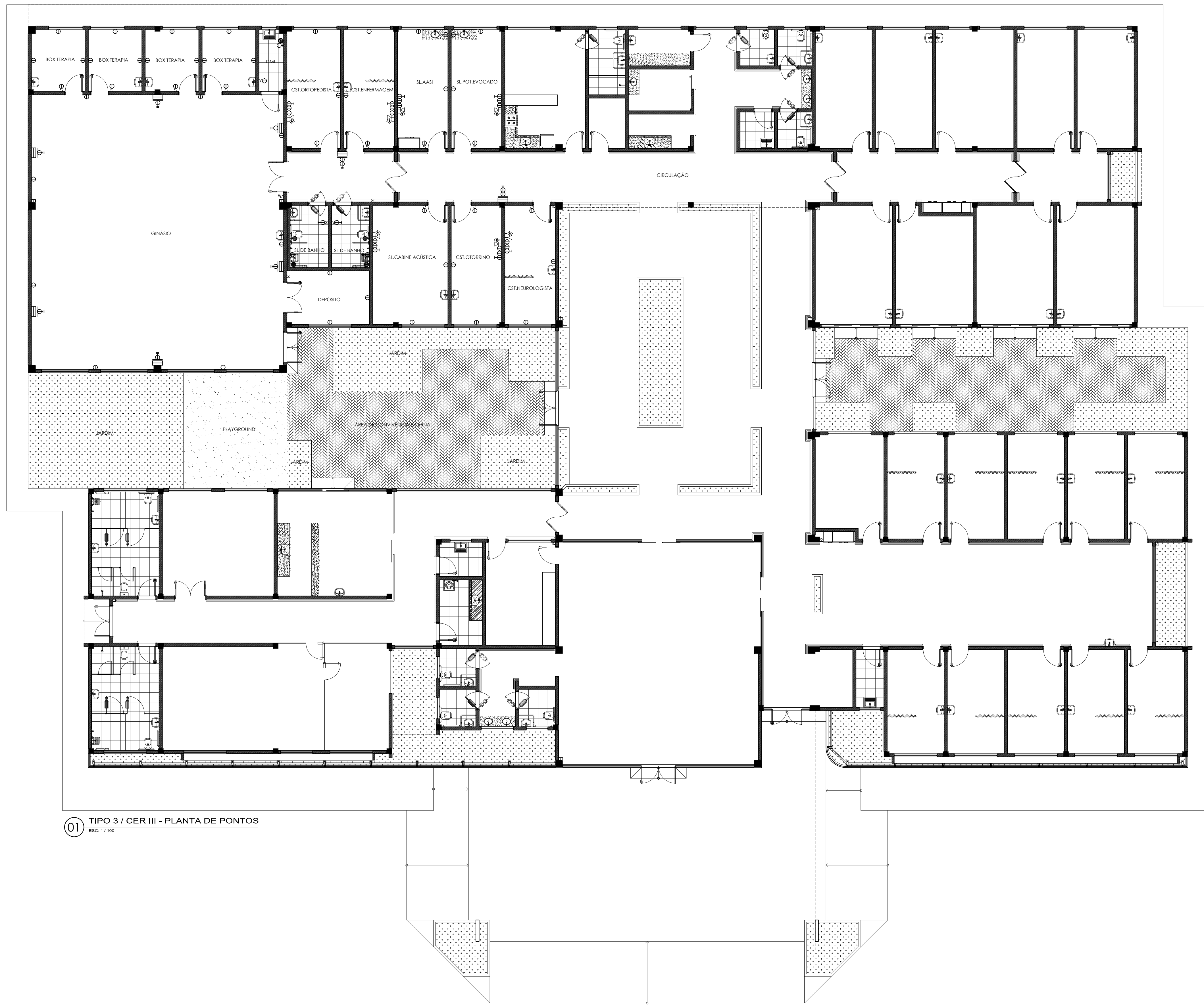
01 TIPO 3 / CER III - PLANTA DE PONTOS ESQ: 1/100